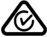
表 4：配接卡標記和認證

配接卡的設計和實作將電磁放射、無線電波頻率能量的磁化率和靜電放電的影響減至最低。